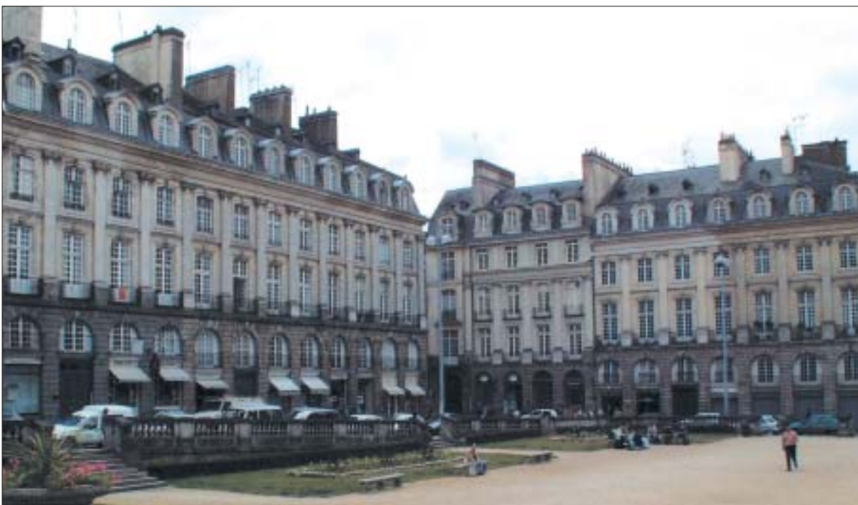
Document 4 : place du Parlement (XVIII e siècle)